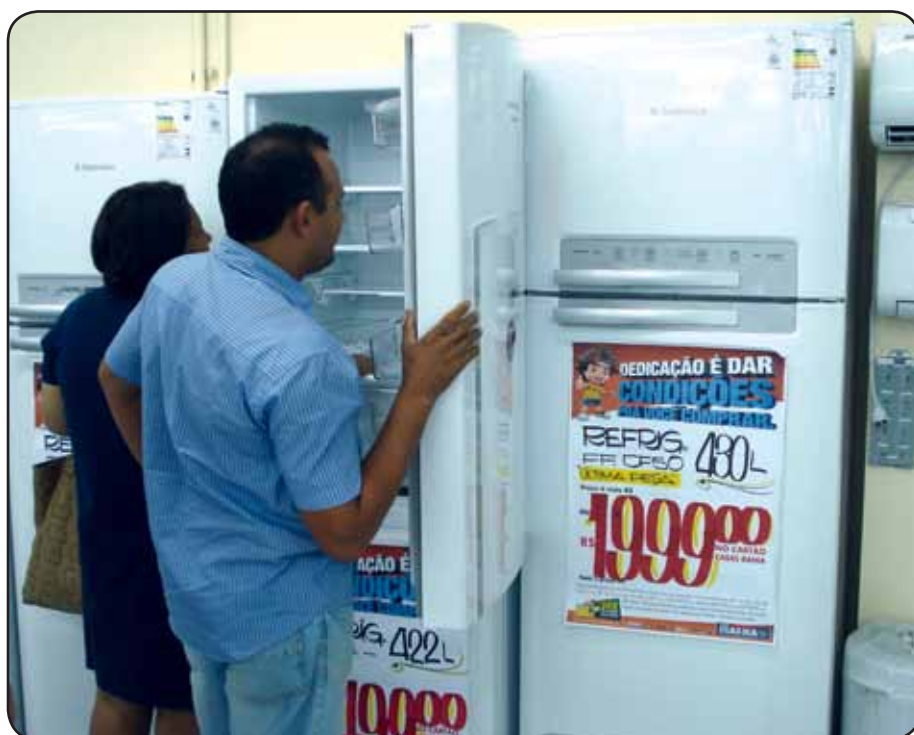
Dilatação do IPI até junho leva mais consumidores às lojas de Brasília. Medida deve aquecer a economia e gerar empregos em todo o País

O alívio tributário valerá até o fim de junho. Desde o início do ano, a alíquota do IPI para fogões passou de 4% para zero, a dos refrigeradores caiu de 15% para 5%, a das lavadoras, de 20% para 10%, e a dos tanquinhos, antes de 10%, foi zerada, dis-