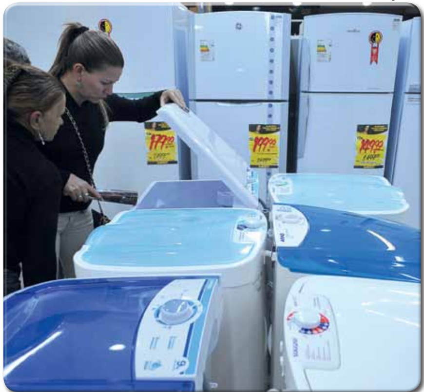
Consumidoras examinam máquina de lavar numa loja de Brasília