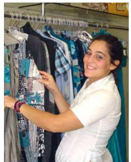
Vendedora de loja exhibe otimismo diante do crescente movimento