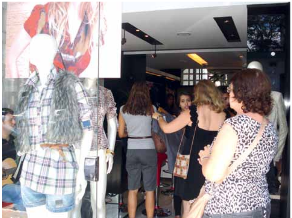
Dia das Mães eleva faturamento das lojas de rua e de shoppings. Confecções, artigos de couro e perfumes são os produtos mais procurados

O dia das mães é considerado como a segunda melhor do ano para o comércio, só perdendo para o natal. Os cartões de crédito respondem por 67%