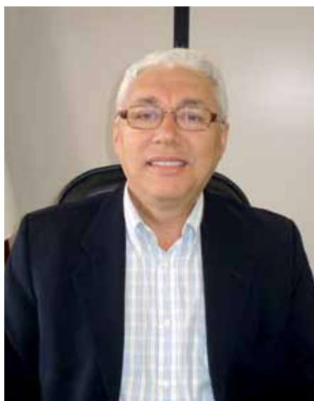
Messias voltará a se reunir com lojistas para debater os puxadinhos

Dos 212 blocos comerciais da Asa Sul, somente 33 conseguiram aprovar projetos urbanísticos na Administração de Brasília. Só que apenas um está de acordo com as regras.